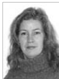
Ina-Maria Meckies Medien